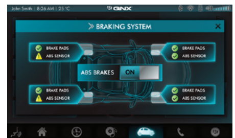
ネイティブインターフェイス 基盤となるハードウェアやシステムサービスに対する安全に制御可能なインターフェイス API