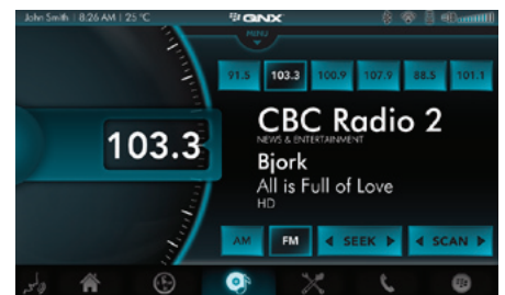
ラジオ 特定プラットフォームで、ボード上のDSPを利用したRDS対応ラジオインターフェイス