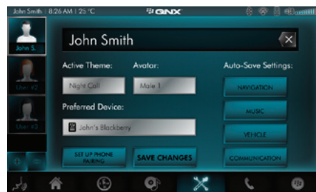
パーソナライズ機能 ダウンロード可能なアプリケーションを含むインターネットユーザーインターフェイスのスキン変更