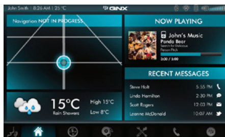
ホームスクリーン HTML5 ベースのアプリケーションウィジェットでカスタマイズ可能なメインスクリーンを作成