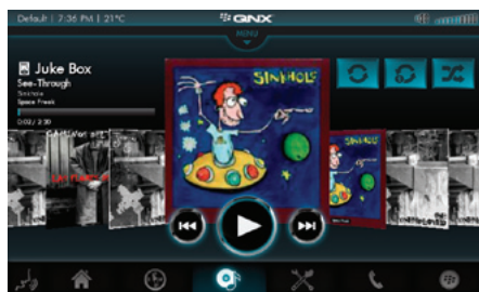
マルチメディア iPod/iPhone、DLNA サーバー、USB マスストレージデバイス、ストリーミングインターネットラジオからのフル機能メディア再生に対応