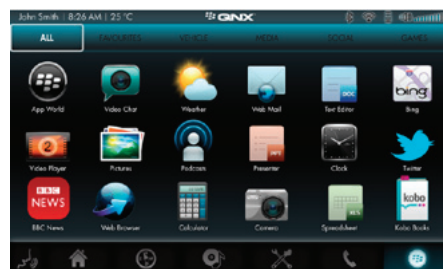
アプリケーションストア ダウンロード可能なアプリケーションとアプリケーションストア機能に対応